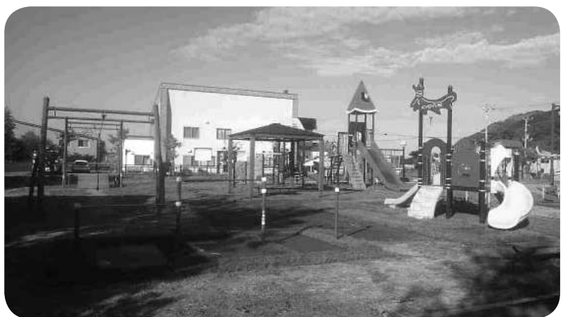
憩の広場整備工事完成写真

負担補助でしょうか。運営状況の資料の中に外出支援サービスについて書かれています。使用者は0人です。当然だろうと私は思います。なぜなら、ほぼ外出できない人は入院患者だと思ってしまう。ある住民の方で『バスやタクシーに乗れない』と言う方がいました。どうしてか、わかりますか。小樽の病院に行くまでトイレに3回寄らないと駄目だと言うのです。外出支援サービスの対象者は、実によくまくかわすために作文をされたと思えました。そうではなく、困っている方々を支援できて初めて福祉だと思えます。例えばタクシー券はタクシーの利用だけでなく民間の介護業者も利用できることになると気も使わず、安心してゆつくり病院に行けるのではないのかと思います。今後できないこ