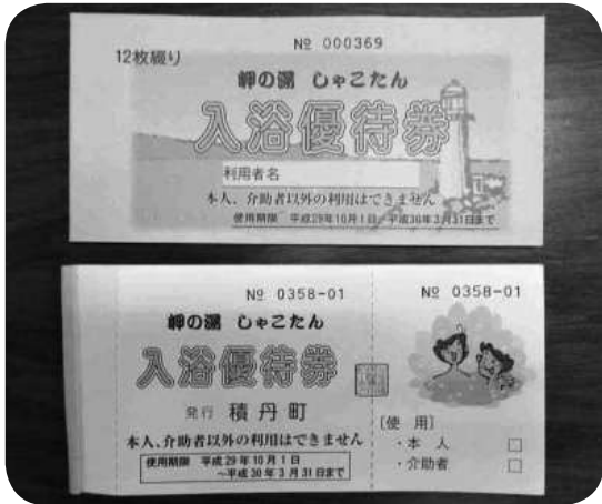
平成29年度岬の湯しゃこたん入浴優待券

6枚つづりに変更し交付していますが、いろいろな方の話を聞いた中では、楽しみにしている方や要らないという方もおりました。現在は、介助される方は一緒に券が使えるという形で交付しています。が、その他の方々を対象にすると、後期高齢者医療事業の補助金を活用し財源の一部に充てているため、補助対象の趣旨と少しかけ離れる部分もありますので、委員から貴重な意見をいただきましたので、今後できる限りで調整をさせていただきます。と思います。