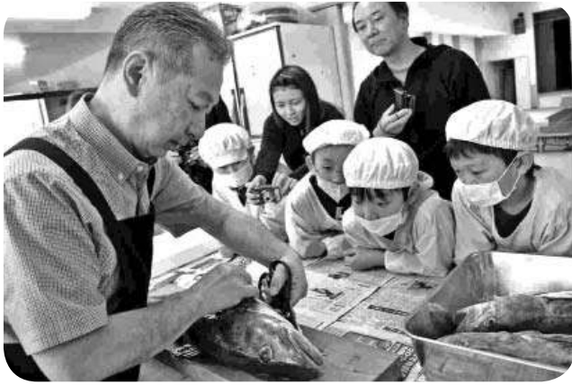
水産業技術指導員による 魚捌き体験教室〔余別小〕(H30.2.22)

域振興に役立つという制度の趣旨からも一定程度の成果が得られているのではないかと考えております。しかし、一方では、任期終了または退職後に残念ながら4名の隊員が町外へ転出しているという実態もあります。一般社団法人移住・交流推進機構が実施した平成29年度の地域おこし協力隊に関する調査によりますと、隊員の今後の定住、定着に向けての課題としては、起業・就業・就農に係る技術・知識の習得・活動資金の確保などについて8割を超える隊員が課題として答えている結果から