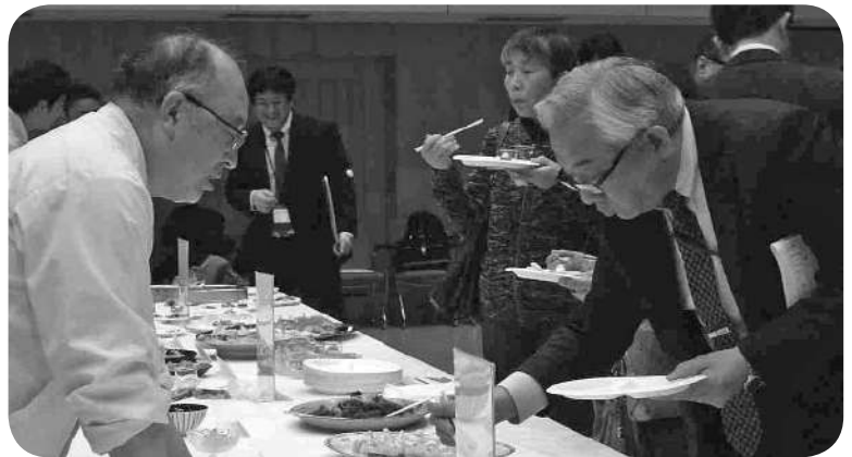
積丹GINプロジェクト事業報告会及び マリアージュ交流会〔試飲・試食会〕(H30.3.2)

岩本委員 スケジュールがかなり遅れているというのがわかりましたけれども、この事業は一応5年間である程度の評価を出さなければいけないと思いますが、KPI（重要業績評価指標）の達成がまるつきりできないとなると、町のほうにも影響が及ぶのではないのでしょうか。この事業者ができないのだから仕方ない、それで済むものでないと思います。この補助