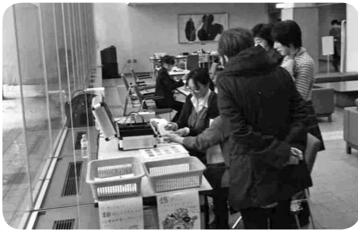
積丹元気応援ポイント対象事業（ワンコイン健診）

らうと傷病だけでも、外出はできます。除雪や外出ができない人は歩行困難ですよ。そうならな