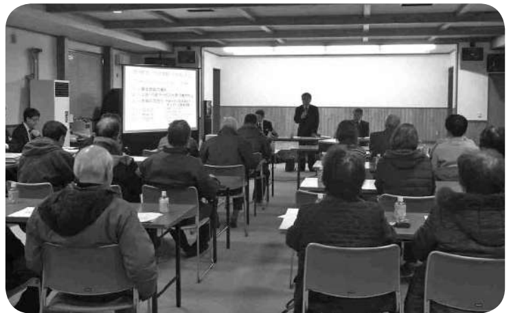
平成30年度「町長室」出前懇談会・野塚地区 (31. 2. 12)

出前懇談会についてですが、町長は2期目を迎えられまして、良い加減で町民の意見だと考えていることなども把握され、町民自体も町長の考えなどがある程度の把握ができていないかと思えます。集まってきてくれている方は大体限られてきており、中だるみはこれは仕方がないと私は思います。それで、大切なのは、出前懇談会に来ることができない弱い立場の方々だとか、また小学生、中学生、高校生のそういう人たちの声はとても大切ではないですか。それで私が思うのは、もっと簡単にそういう子供たちの声や弱い立場のお年寄りの声を聞ける環境づくりというようなことが必要ではないかと思えます。余り気を張り、ああだこうだということでは無いにしても。つい最近、中学生か高校生がフェイスブックで『積丹町のスキー場はいつからやるのですか、知っている人いませんか。』という人がいました。またこれはずっと以前、私のところに小学生だと思えますが『観光せんだあつて英語なのに何で平仮名なのですか。』という手紙が来ました。そういう子供たちの大切な