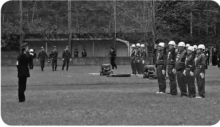
5ヶ町村の消防団員による小型ポンプ操法競技 【北後志消防大会（積丹町開催）より】

介護などの社会保障制度を中心とした政策の安定維持対策や子育て支援制度の拡充などに取り組んでいると承知しています。人口減少、高齢化という社会現象は、自治体の行政運営や地域産業、住民生活に大きな影響を及ぼす事象・現象であります。しかしながらその解決策については、私は1つの自治体での対策による解決にはおのずと限りもあるのではないかと、そこに国の政策の役割の重要性があるのではないかと考えます。