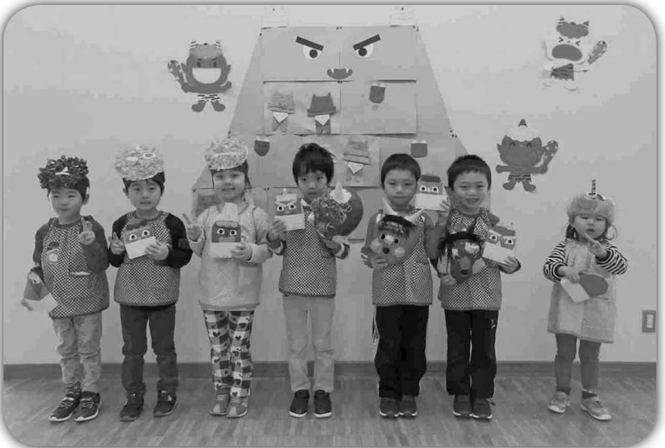
節分会～みなと保育所～（H31. 2. 1）