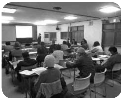
▼日司地区 (H30. 2. 19)