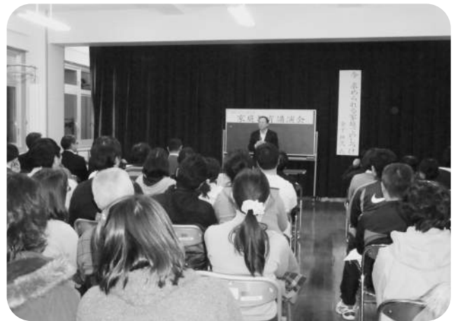
▲平成28年度家庭教育講演会

2つ目に、特に教科や教職に関する高度な専門的知識や学びを展開できる実践的指導力を養成するためには、教科や教職についての基礎、基本を踏まえた理論と実践の往還による教員養成の高度化が