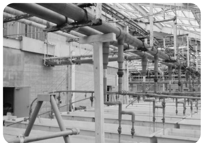
▲水産種苗生産センター内部

そこで、その調査結果についてであります。その要点を申し上げますと、1つ目は、建物本体につきましても主要構造部の鉄骨部分の板厚が設計厚に比べると約54%程度減っているという状況にあること。2つ目は、機械設備や電気設備などについては施設整備後30年以上経過し、腐食や錆びが発生し、部品の調達等も困難なものが非常に多いこと。3つ目は、海水の取水管、送水管などの取水設備は全体がさびで覆われており、腐食により箇所によっては穴が空いている部分もあり、管路の清掃や改修等を施して再生利用を目指したとしても、海中、海水対応設備の特殊性からして現状のまま再生利用することは難しいこと。ただし、南防波堤基部の水中に設置している海水の取水口につきましても砂や土砂で埋まること