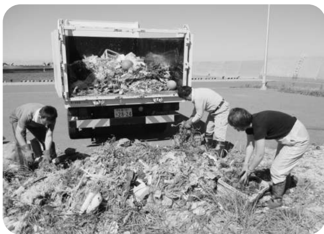
▲町内クリーン作戦 (H28. 8. 28)

2つ目の最終処分場、クリーン センターの使用可能年限について ですが、建設当時の埋め立て処分 地の計画容量は1万220立方メ ートルで、平成28年3月末現在で は2,810立方メートル、計画 容量対比27・5%ぐらいと推計し ています。今後、大量の災害廃棄 物の発生がなく、平成27年度の年 224立方メートル程度の排出量 で推移した場合、今後の中間覆土、 閉鎖時覆土等の追加埋め立て量等 を考慮して推計しますと、埋め立 て完了を平成46年、約18年後にな るのではないかと推計しています。 なお、埋立地以外にクリーンセ ンターの管理棟には管理型処分場 としての水処理施設や、さまざま な計器類等があります。これは は、おおむね15年の基準で設計さ