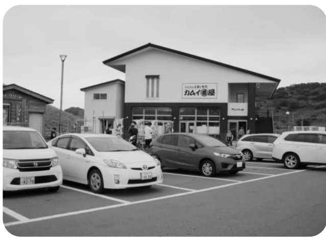
▲しゃこたん土産と喰処カムイ番屋 (ペニンシュラ)