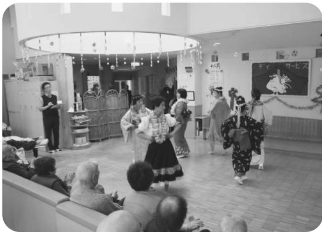
▲美国婦人会によるやすらぎ慰問 (H28. 12. 13)

また、②の電力会社が使用許可しているのかわからない。そうでしょう。わからないと思います。しかし、売電をしようとするこの会社自体が、レジャーエンスジャパン推進協議会自体がこういうこと、基本的なことすらわからないで町長に誘致を勧める自体がいかげなものかと、私は思っています。電