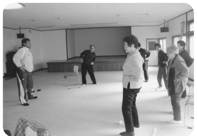
▲高齢者のための巡回型運動教室（日司地区）

災害対策なのですが、先ほど在宅にいる方75名いらっしゃると伺いました。災害が起きた際に75名の方全員に対して関係団