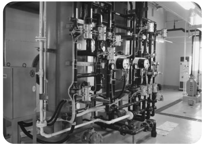
▲クリーンセンター内の浸出水処理施設

3つ目の埋め立て処分場の浸出水についてであります。管理型処分場でありますので、ゴミと雨水等の混合したものの中から有害な浸出水が地下に浸透しないように措置を講じています。それを把握するための環境影響調査も義務づけられており、その結果によりますと、今のところ大きな問題のある数値は出ておりません。これらの結果については毎月出るもの、あるいは1年に1回の調査結果が出るものがあります。今のところは異常値は発見されておりませんが、こうした観測機器等の整備につきましては、ご指摘があったように重要な施設でありますので、留意してまいりたいと思います。2点目の水産種苗センターに関連して、リアクトの6ページにあ