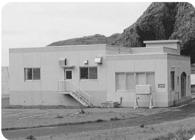
▲下水道終末処理施設（日司町）