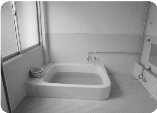
▲修繕された研修センターのお風呂