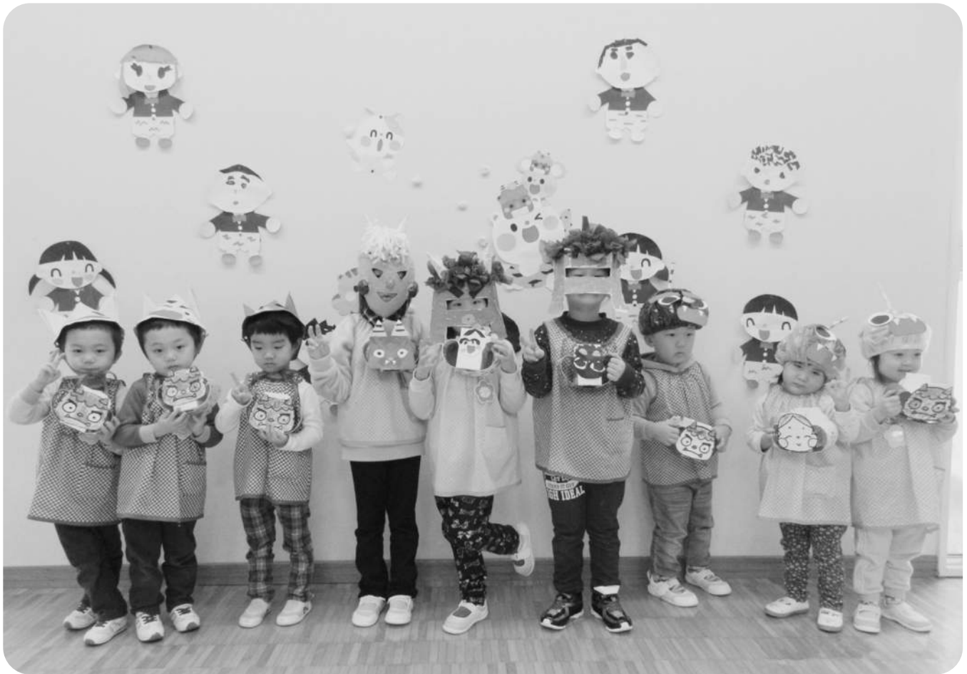
節分 ～みなと保育所～ (H29.2.3)