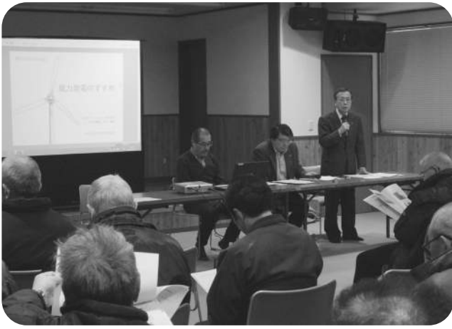
▲小型風力発電施設設置計画に係る住民説明会（野塚地区）

ようにメンテナンスを実施することにより当該公共施設を長く、そしてきれいに保つことができるということにつきましては十分理解しながらも、一般財源のみを財源としてできる、またできない維持修繕につきましては、非常に厳しい財政運営の中で限られる状況にあります。