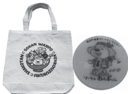
▲ソーランわんポくん入りの「オリジナルエコバッグ」と「防犯用ステッカー」

参加者は少しずつ増加していますが、まだ参加したことがない方、この事業を知らない方もいると思います。