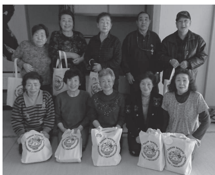
▲美国宝寿会の皆さん