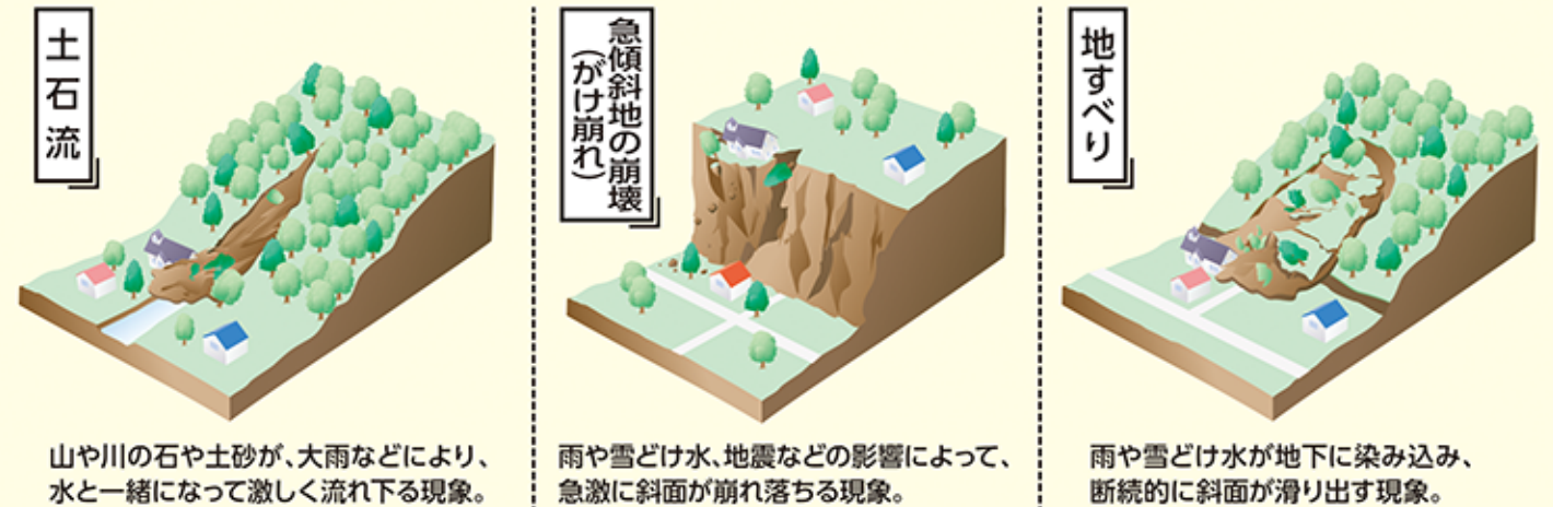
山や川の石や土砂が、大雨などにより、水と一緒に激しく流れ下る現象。

一般的に土砂災害は、降雨や融雪で地中の水分が増えて地盤が緩み、さらに長雨や集中豪雨が続いたときに発生するとされています。土砂災害の要因となる降雨について、日頃から注意しましょう。