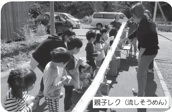
親子レク（流しそうめん）