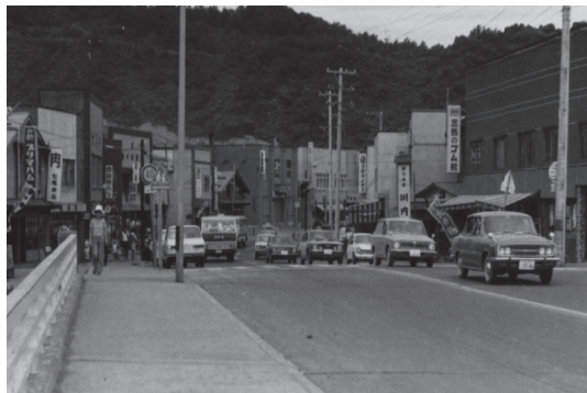
▲美国橋（昭和41年以降）

ては資料がなく、不明な点が多くありますが、特に明治期には、度重なる水害で何度も架け換えられたことがわかります。