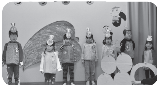
みなと保育所（12月6日）