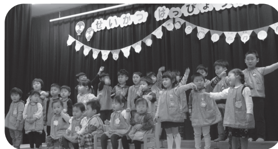
びくに保育所（11月28日）