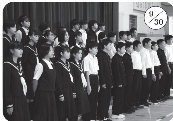
▲美国中学校 (全校 35 名)

各学校ごとに、普段の学習の成果を織り交ぜ、工夫を凝らした発表をする児童・生徒の大きく成長した姿に、父母や地域の皆さんから温かい拍手が送られました。