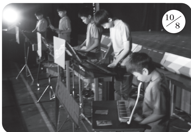
▲野塚小学校 (全校 5 名)