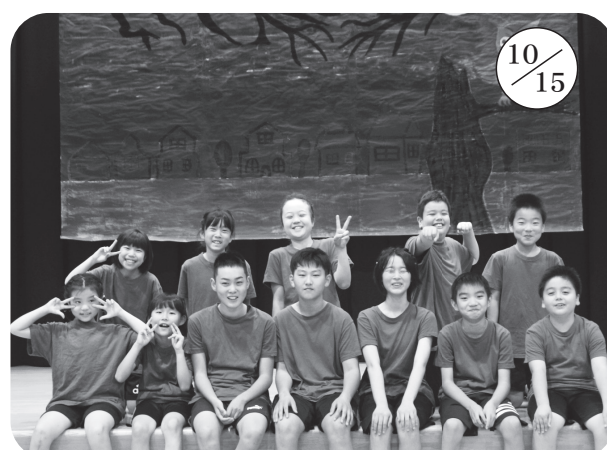
▲余別小学校 (全校 12 名)