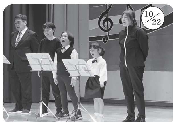
▲日司小学校 (全校 2 名)