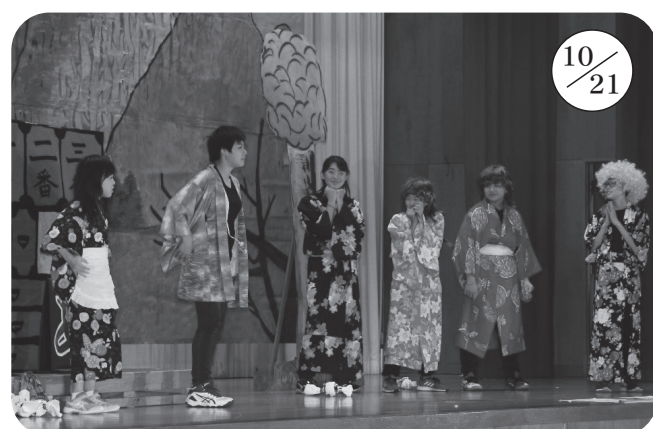
▲美国小学校 (全校 38 名)