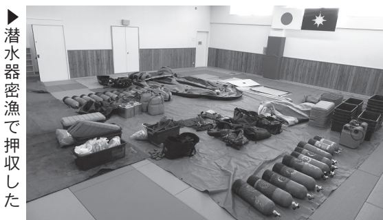
▶潜水器密漁で押収した証拠品

〒047-0007 小樽市港町5番2号 小樽海上保安部 (管理課) TEL 0134-27-6118