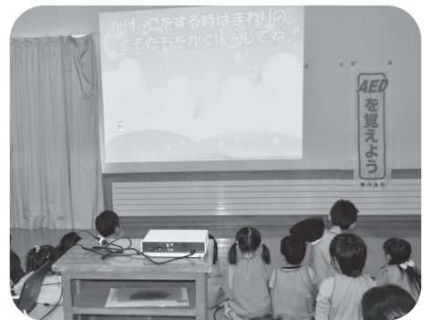
▲真剣な様子で学ぶ園児達