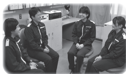
▲海上保安学校学生寮の様子

https://www.kaiho.mlit.go.jp/recruitment/