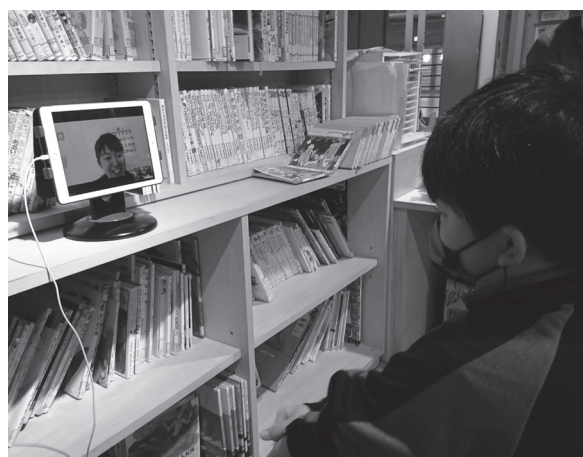
▲余別小学校での学習支援（2月1日）

また、余別小学校でも2月1日より同様の取り組みが開始され、両校とも3学期末まで、週1回程度実施する予定です。