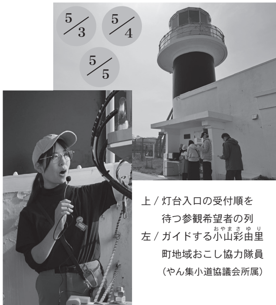
上 / 灯台入口の受付順を待つ参観希望者の列 左 / ガイドする小山彩由里 町地域おこし協力隊員 (やん集小道協議会所属)

今後は、子ども向けの灯台ツアーや夜間の神威岬を楽しむ「神威岬ナイトツアー」を秋に予定しています。