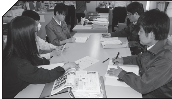
▲広報担当者（左手前）から掲載記事案とスケジュールの説明を聞く企画課職員

例えば、今月号2・3ページの「地籍調査」記事は建設課7ページの消防ニュースは、積丹支署広報担当職員が誌面内容を練っています。関係課等と記