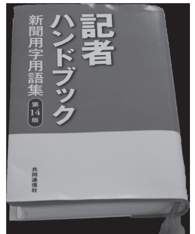
▲広報担当者必携「記者ハンドブック」用字用語の表記は、本書にならいます。