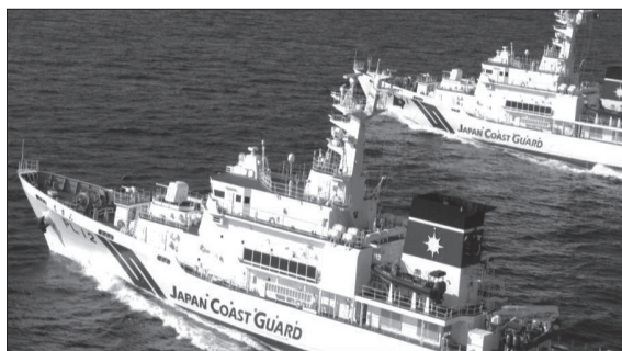
▲巡視船えさん(小樽海上保安部所属)