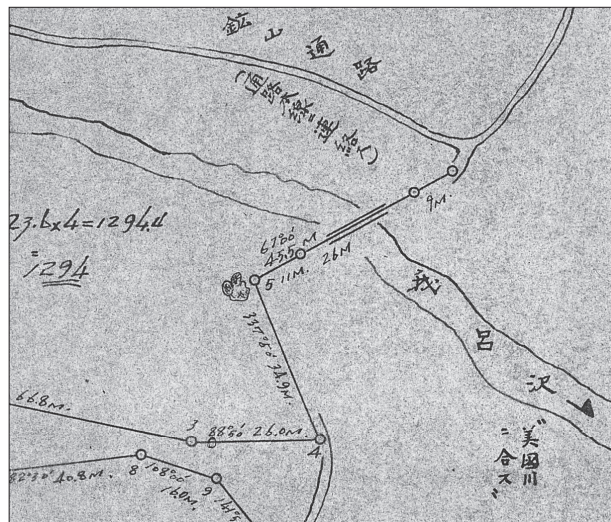
美国重田鉱山発電所位置図（一部）

採掘された岩石を運搬するための索道に関する図面として、「原動所停留場之図」・「緊張停留場之図」・「原動所