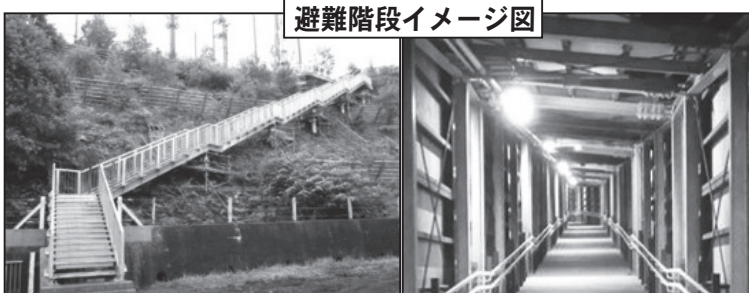
避難階段イメージ図

る「避難階段」と美国小中学校前の道道までの「連絡道路」を整備するもので、道内の国道の高台や高架区間等の立地が防災対策に活かせる全道16箇所を対象。当町の美国峠もその整備箇所の1つに選定されました。