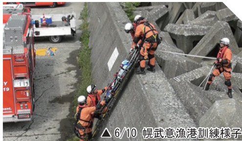
△6/10 幌武意漁港訓練様子

救助現場は、狭く老朽化による部分破損を予測して救出するほか、引き上げる必要があるなど難易度が高いことを念頭に、各隊員は救出方法を検討。要救助者の不安軽減と安全な搬送のほか、隊員自身もバランス保持や