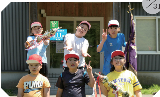
▲美国中学校（全校生徒 26名）