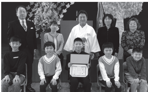
野塚小学校 (卒業生 1名・3月19日)