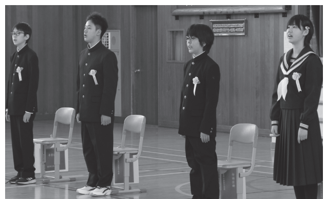
美国小学校 (卒業生 4名・3月19日)