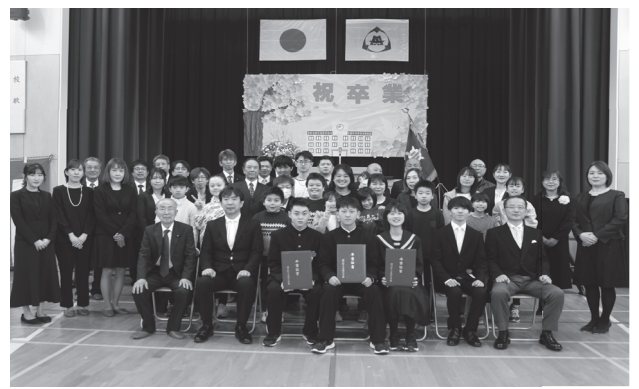
余別小学校 (卒業生 3名・3月19日)