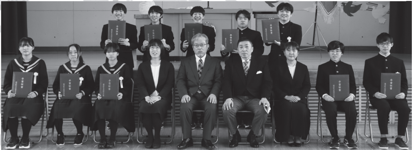
美国中学校 (卒業生 12名・3月15日)

町内小中学校で「卒業証書授与式」が行われ、各学校長から卒業証書が手渡されました。 新たなスタートラインに立つ卒業生の晴れやかな表情と、我が子の成長に目を潤ませる保護者の姿がありました。