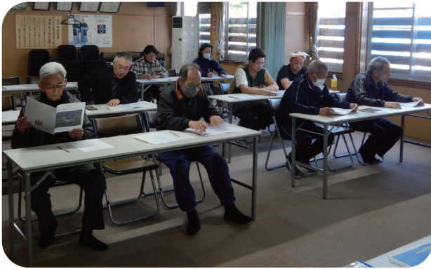
▲住民説明会の様子（4月13日・来岸会館）

積丹町の地籍調査事業は、平成17年度に着手し、令和3年度までに美国地区、幌武意地区、入舸地区及び日司地区市街地周辺が完了しています。 また、日司（泊）地区及び野塚地区市街地については、今年度最終作業工程を実施予定です。 町内6地区目となる西河・来岸地区市街地の地籍調査事業については、昨年度、事業着手してお