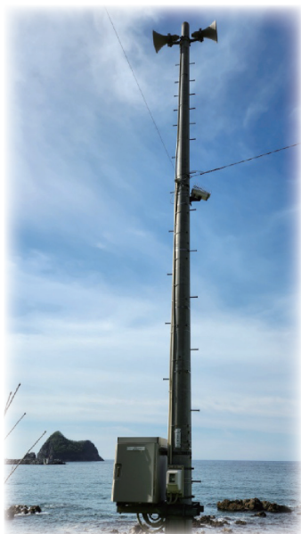
▲屋外拡声器と定点カメラ（小泊地区）