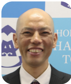
【株式会社しゃこまる】