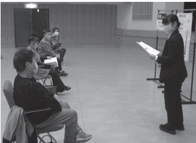
▲4月のいきいきクラブの様子