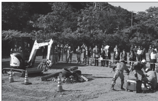
▲配備資機材運用デモンストラーション