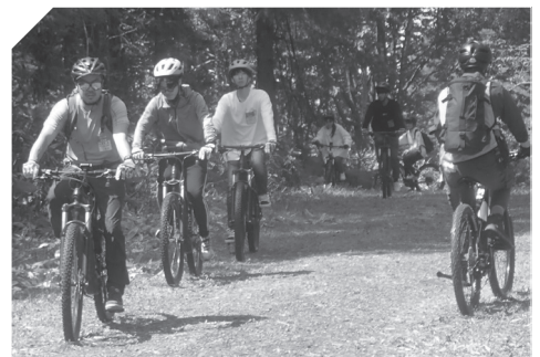
▲森林アクティビティ「e-バイク体験」の様子

昼食には、積丹町産の海産物を贅沢に使ったシーフードカレーが（社）積丹観光協会から提供され、おかわりの列ができるほど好評でした。