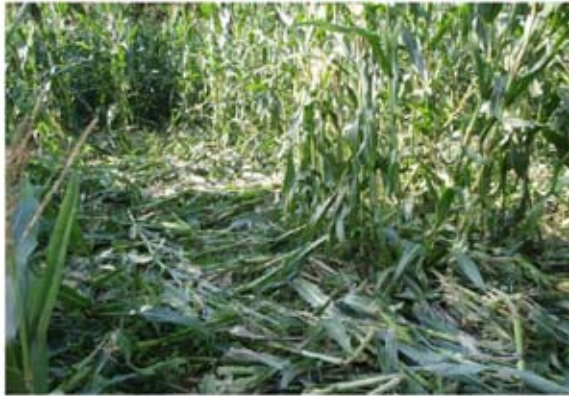
ヒグマに荒らされた畑