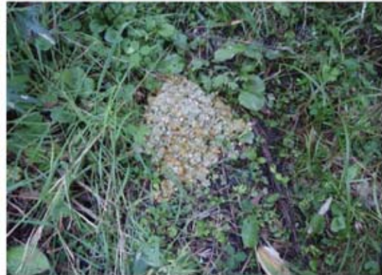
ヒグマの糞(コーン類)