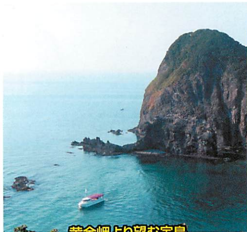
黄金岬より望む宝島