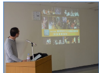
事業報告会の様子(H24.3.26)

※「岬の湯しゃこたん冬の花火事業」は事業が完了していないため「補助金額」は、交付決定額です。