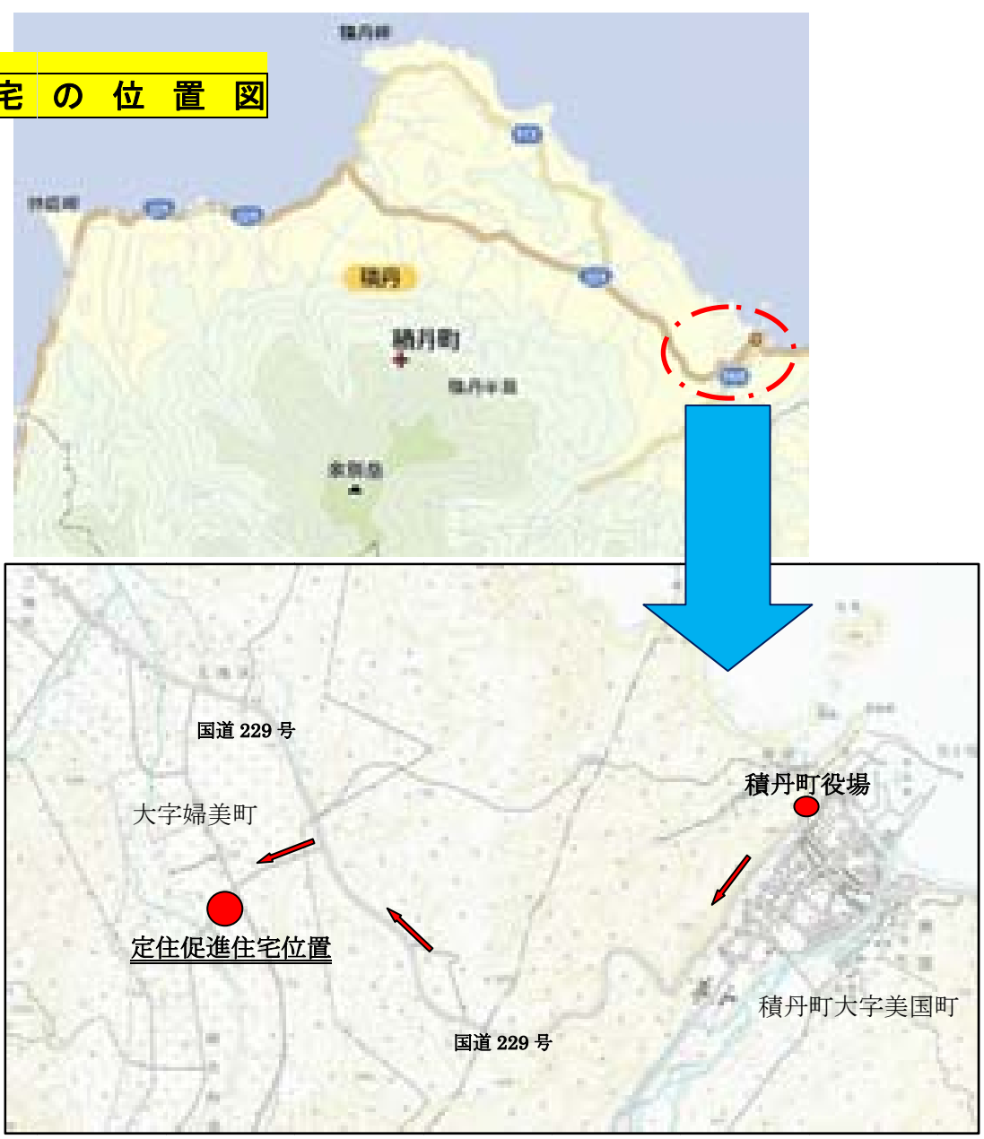
積丹町役場から車で約10分