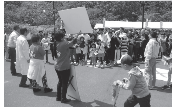
▲大盛況の「さくらますウルトラクイズ」

今もなお原始の姿を保つ保護 河川「余別川」で、豊かな海を 育むための「森・川・海」の榮 養循環を支えるサクラマスを、 保全し、その価値を伝える取組 の更なる拡大を期待していま す。