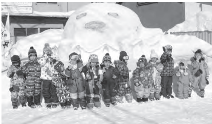
▲冬でも元気いっぱいの子どもたち！

体験を通して全国の皆さんに伝えられるように、そして、私の故郷奈良県のことを積丹町の皆さんにお伝えできるように、発信していきたいと思っています。積丹町に移住し、わからないことがたくさんの中、私に手を差し伸べてくださった皆様、いつも明るい笑顔で私を元気にしてくれる子どもたちに本当に感謝しています。どうぞこれからもよろしくお願いたします。