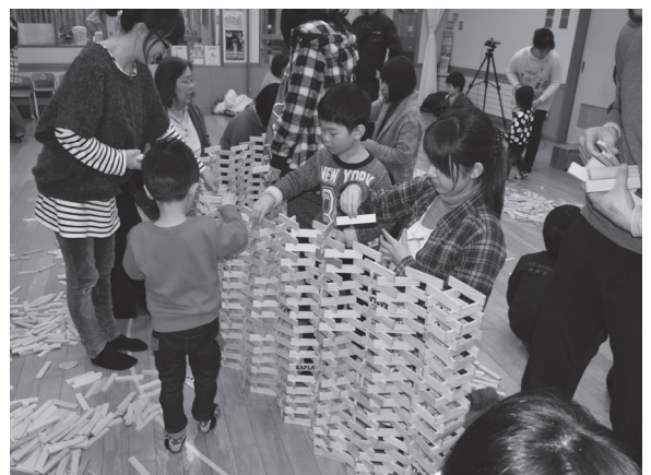
▲カプラ講演のようす

子どもたちに人気がある木でできたブロックに「カプラブロック」があります。木の板を積み木のように積んで、建物や動物、乗り物などいろいろなものを作ることができます。また、カプラを使ったあそび方を多くの人に広めるために、「子育て講演会」などで、親子であそぶ機会を設けたり、保育の自由あそびの中でも取り入れています。