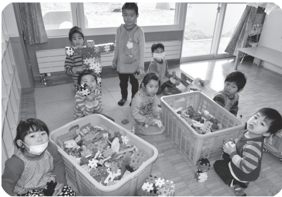
▲ニューブロックあそび