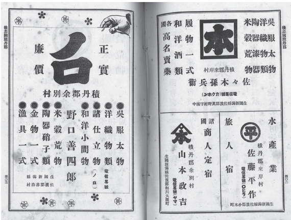
▲『北海道営業鑑』に記載の広告

冒頭で紹介したテレビ番組は、今年秋以降に放送予定とのこと。明治期の積丹町がどのように描かれるのか、放送日時やタイトルが決まりましたらお知らせいたします。