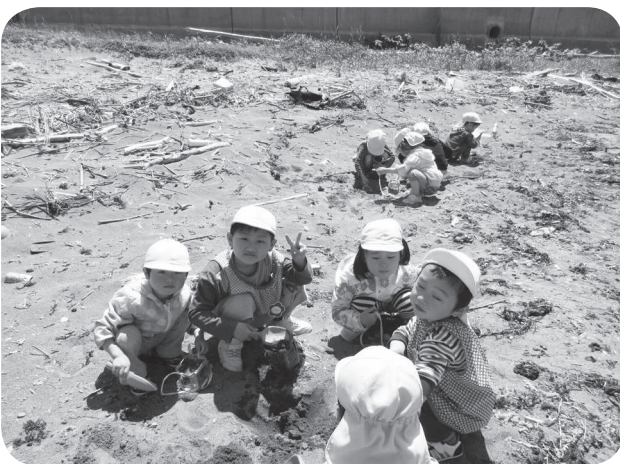
▲日司海岸浜あそび（みなと保育所）