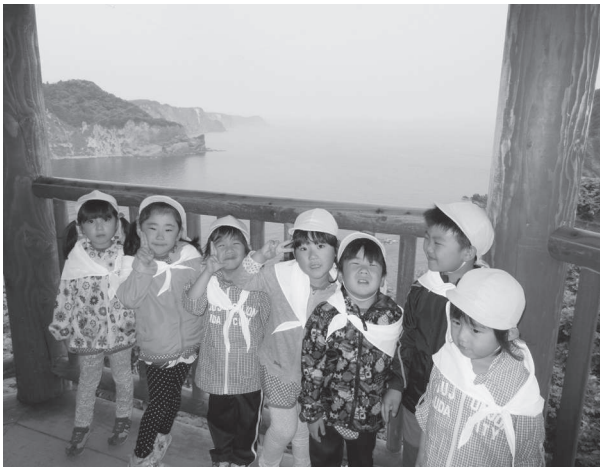
▲黄金岬への散歩（びくに保育所）