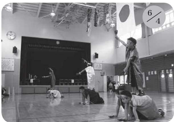
▲余別小学校 (全校8名)