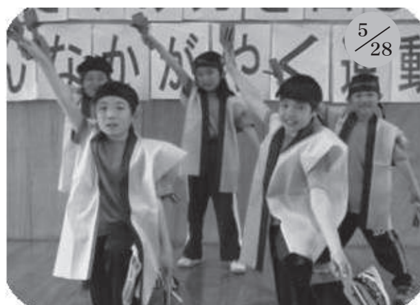
▲野塚小学校 (全校5名)