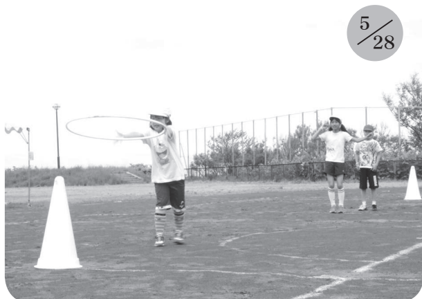
▲日司小学校 (全校3名)