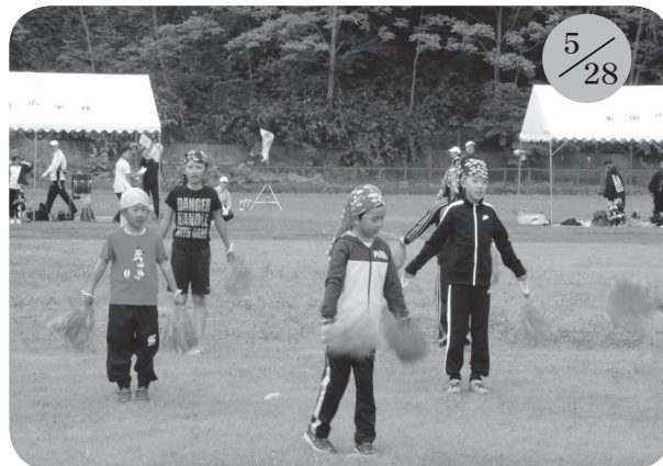
▲美国小学校 (全校52名)

また、余別小学校には20年以上続く北海道大学が、日司小学校には北海道教育大学札幌校の学生の皆さんの交流ボランティアによる協力がありました。