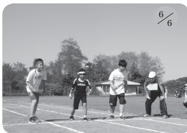
▲美国中学校 (全校41名)