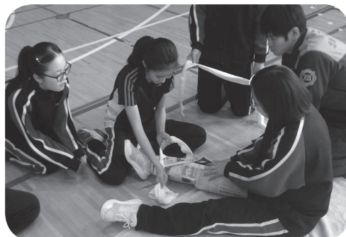
▲身近なものを使った固定処置

大きな声で実技に取り組む生徒が多く、万が一の場合には、自分たちで救うという意欲が感じられました。