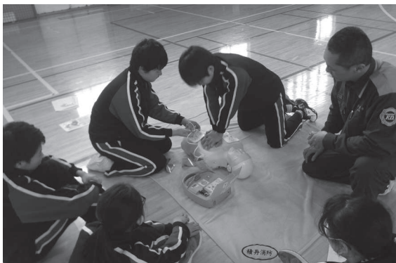
▲AEDを使用した心肺蘇生法

講習では、4名の隊員が身近なものを使った固定処置の仕方や救急通報のポイント、心肺蘇生法、AEDの使用方