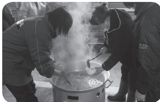
▲婦人（女性）防火クラブ「炊出訓練」

訓練では、災害時に食材の購入ができない場合でも対応できるような会員が食材を持ち寄り、「鮭鍋」と「ポテトサラダ」の調理が行われました。普段と勝手の違う大型の調理機器の使用法を一つひとつ確認しながら丁寧に調理を進めていました。