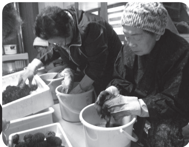
▲ウニ殻の加工処理（美国宝寿会）