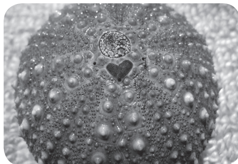
▲ハート型をした第一生殖板

一方、同じく積丹町を代表する水産物のウニですが、殻の頂点にある肛門の周りの棘を取り除くと図で示したような5枚の生殖板が見られます。