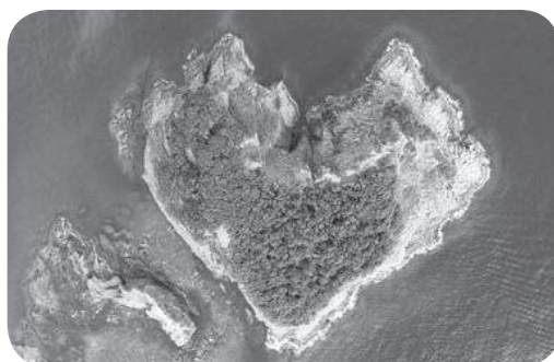
▲上空から見た宝島

この5つの生殖板の内、最も大きな第一生殖板は、よく見ると写真のようにハート型をしています。また、宝島も上空から見ると同じようにハート型をしています。 このように、ウニの町と呼ばれる積丹町に存在している宝島がウニの生殖板と同じような形をしていることは偶然の現象でしょうか。 私は、積丹町で暮らしているうちに、数億年にも及ぶ地形の成り立ちとウニという生物の進化の歴史の過程で、もしかすると宝島はウニの第一生殖板であり、美国町は元々巨大なウニだったという第五番目の伝説もあるのではないかと想像をふくらませてしまっています。