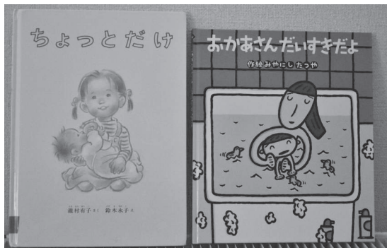
▲今回紹介する2冊の本

(絵本抜粋) ぼくね、おかあさんがだいすき。おかあさんは、「はやくおきなさい！また、ねぼうでしょ」っていうけれど、やさしく「おはよう」っ