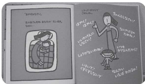
▲「おかあさん だいすきだよ」の一説

ていいながら、ぎゅつとだつこしてくれたら、ぼくね、おかあさんのこともつとだいすきだよ。