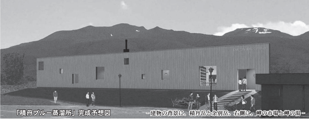
「積丹ブルー蒸溜所」完成予想図