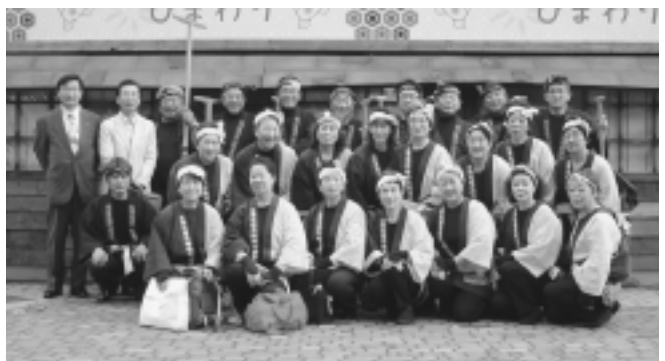
「ワオドリソーラン」に参加した鯉場音頭保存会と踊り子のみなさん