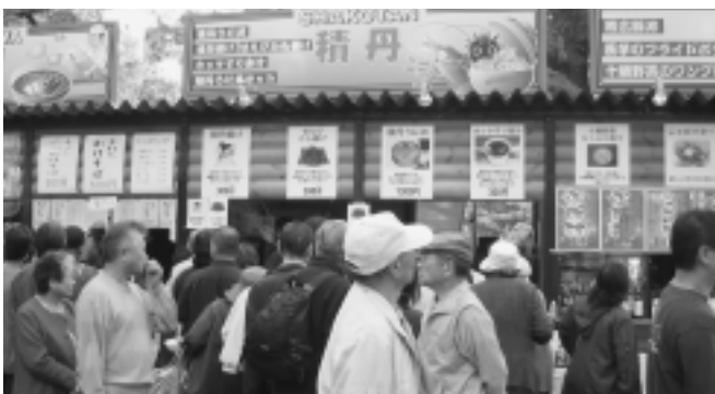
町観光協会は「北のフードパーク」に出店し、浜鍋やうに丼を販売。食事をする暇もないほど大盛況であった積丹町ブース