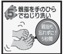
⑤ 親指を手のひらでねじるように、5秒間ゴシゴシ洗う