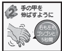
② 手の甲をのばすように、5秒間ゴシゴシ洗う