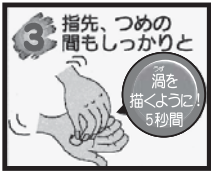
③ 指先やつめの間も、渦をかくように5秒間ゴシゴシ洗う