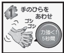
① 手のひらをあわせて、5秒間ゴシゴシ洗う