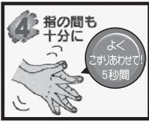
④ 指の間も十分に、5秒間ゴシゴシ洗う