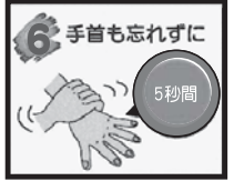
⑥ 手首も忘れずに、5秒間ゴシゴシ洗う

※最後に、石けんを流水できれいに流して、タオルやハンカチで手を拭いて乾燥させます。