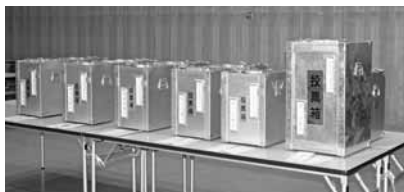
▲各投票所から運ばれた「投票箱」