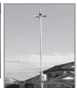
屋外拡声器のイメージ