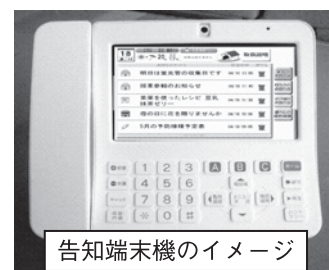
告知端末機のイメージ

あわせて、屋外作業中の方にも非常時等の情報を一斉に伝達する「屋外拡声器」を町内30か所に設置します。