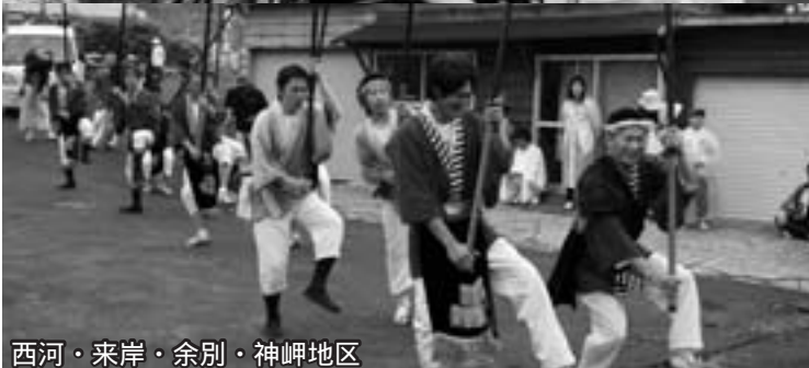
西河・来岸・余別・神岬地区