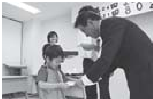
▲昨年のよい歯の子・8020表彰式

そのほか、小中学校の新入生、保育所入所児への歯ブラシプレゼントや巡回歯みがき教室など、子どもたちの健やかな歯を保つための活動を行っています。