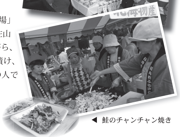
◀ 鮭のチャンチャン焼き