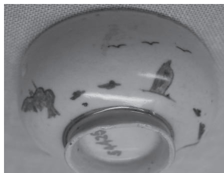
▲神威岩とカモメが絵付けされています。（北海道開拓記念館所蔵）

実際に余別焼の茶碗を見てみると、灰白色の器に追分節の1節、さらに神威岩とカモメが手書きで絵付けされていました。