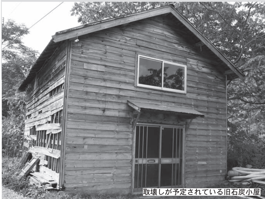
取壊しが予定されている旧石炭小屋