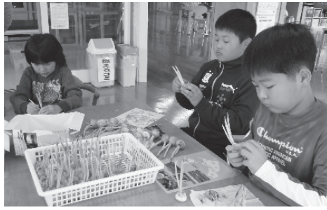
▲余別小児童によるサフラン（めしべ）の収穫作業

業も、いよいよ大詰めとなりました。今年 のニンニク生産は、7月までの干ばつ の影響による小球傾向に加えて、8月上 旬からの降雨による高温・多湿環境下で の乾燥不良により、一部に褐変が見られ ました。また、その後も天候不順が続き、 通常9月の植付けにも遅れが出て、10月 にずれ込んだものもあります。