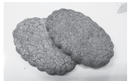
▲試作中の甘エビを練りこんだサブレ

これからは町内の飲食事業者の皆さん をはじめ、町民皆さんのお力が必要にな ると思えますのでご協力よろしくお願 いします。