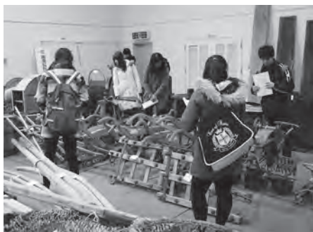
▲旧幌武意小学校を視察する学生達

参加した学芸員課程の学生は、普段大学で学ぶ際、博物館・資料館等の施設にて研究・保存・普及活動等の職務に当たる