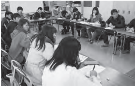
▲B&G 海洋センターで行われた意見交換会

学芸員を養成するため、各大学には学芸員課程が設置されており、ここで学ぶ学生は、それ